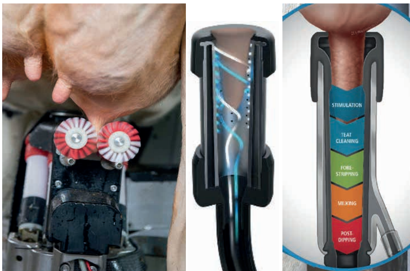
Рис. 4. Различные варианты очистки сосков в роботизированных системах доения

Сегодня многие производители стремятся устранить человеческий фактор из процедуры доения. Лучше всего это обеспечивается за счет роботизации всех процессов. Именно роботизированное доение позволит сделать следующий шаг в развитии молочного скотоводства. Уже сегодня в Европе основную долю проданного доильного оборудования составляют роботы-дойеры. Но как же осуществляется подготовка вымени к доению при роботизированном доении? У различных производителей по-разному. Одни роботы очищают соски щетками, которые после каждой коровы дезинфицируются. Но при этом не сдаиваются первые струйки, да и щетками без одновременной подачи дезинфицирующего раствора сложно очистить загрязненные соски. У других производителей для подготовки сосков к доению применяется отдельный стакан, который не только очищает кожу с использованием дезинфицирующего раствора, но и сушит ее, а также сдает первые струйки. В итоге сосок качественно подготавливается к доению. Существуют и такие роботы, которые одним стаканом и подготавливают коров к доению, и доят