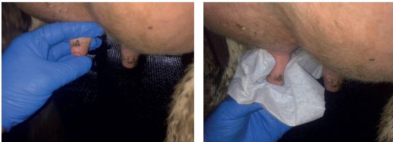
Рис. 2. Правильная очистка сосков должна гарантировать удаление загрязнений и со сфинктера

При смывании сильной струей воды загрязнения с подвесной части капли попадают на вымя зашедших на доение коров. Когда смывают навоз под коровой мощным напором воды, на вымя попадают не только брызги воды, но и грязь. А ведь при подготовке к доению операторы машинного доения наносят пену и протирают салфетками только соски. В дальнейшем, во время доения, капли стекают к соскам. Сосковая резина начинает наползать на вымя или соскальзывать вниз. Возникают подсосы, и загрязнения попадают в молоко. Наполнение или соскальзывание сосковой резины влечет за собой неполное выдаивание коров, а также травмирование сосков.